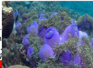
าด ถ. เห w.