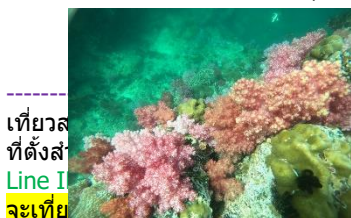
เที่ยวส ที่ตั้งส Line I จะเที่ย

8.ร่องน้ำจาบัง จุดดำน้ำไฮไลต์ หรือจุดปราบเซียน ของจุดดำน้ำโซนใน จุดนี้ มีปะการังเจ็ดสีอยู่เป็นจำนวนมาก แต่เนื่องจากจุดนี้ มีกระแสน้ำที่ค่อนข้างไหลเชี่ยวอยู่ตลอด จึงขึ้นชื่อว่าปราบเซียนของนักดำน้ำ